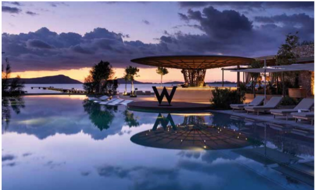
L'une des nombreuses piscines face à la mer du W Costa Navarino.

Par Saliha Hadj-Djilani