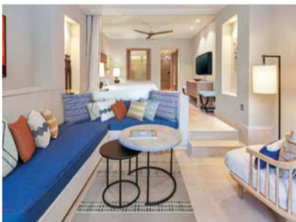
The Westin Costa Navarino..