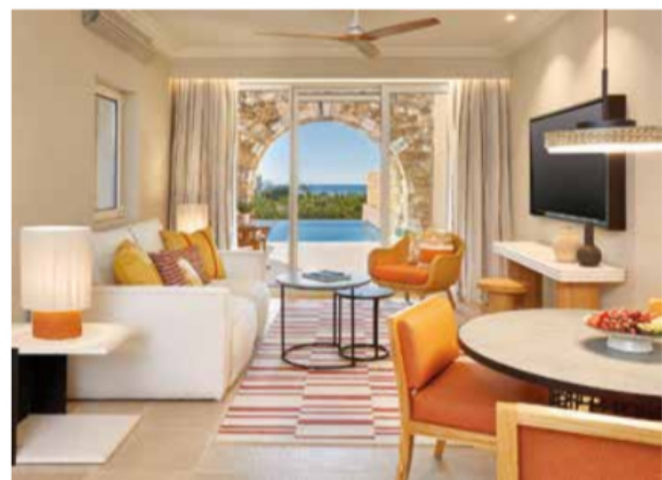
Suite The Westin Costa Navarino.