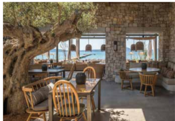
Le restaurant Parelia - W Costa Navarino.