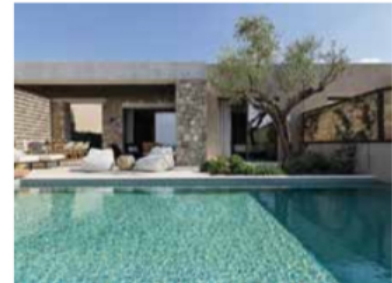
W Costa Navarino - Réception et villa privée.

et de modernité. Menées par le cabinet londonien MKV Design, les transformations insufflent une atmosphère chaleureuse et raffinée, en parfaite harmonie avec la nature environnante.