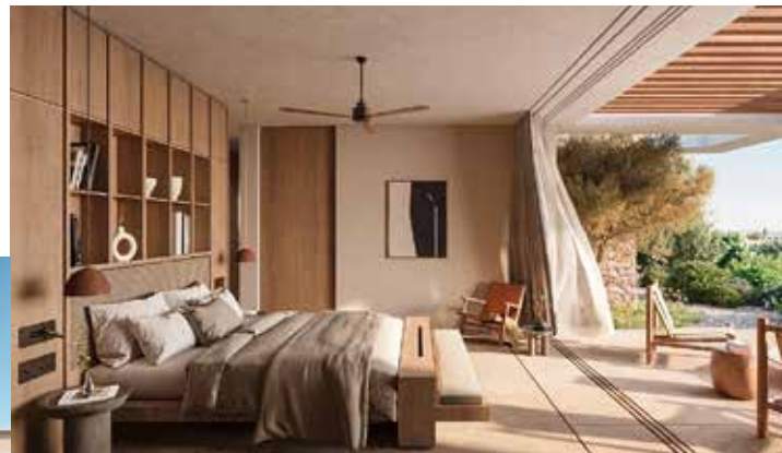
Auch im Inneren dominieren Holz und Naturstein in zeitgemäßem schlichten Stil..