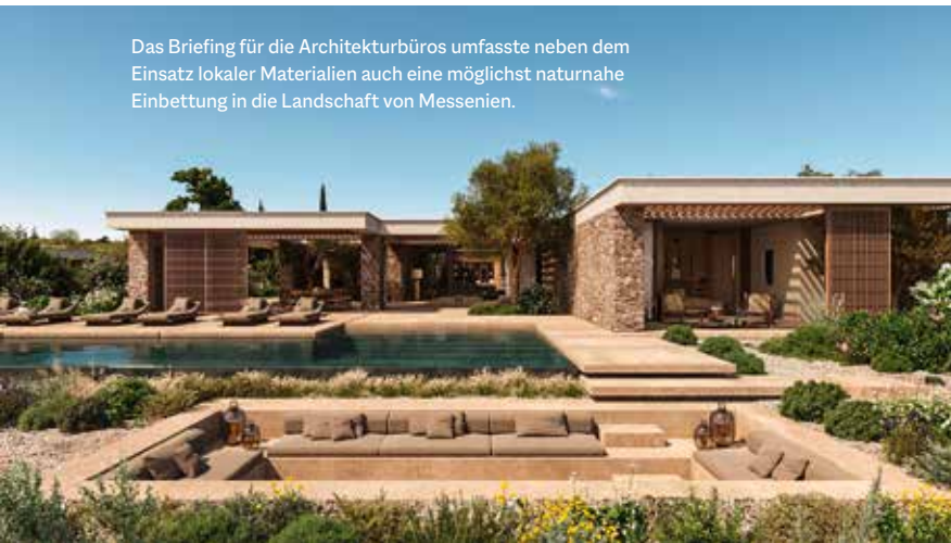
Das Briefing für die Architekturbüros umfasste neben dem Einsatz lokaler Materialien auch eine möglichst naturnahe Einbettung in die Landschaft von Messenien.

Die Käufer der Immobilien können sich aktiv an der Gestaltung ihres Traumhauses beteiligen und sich so betten, wie sie gerne liegen.