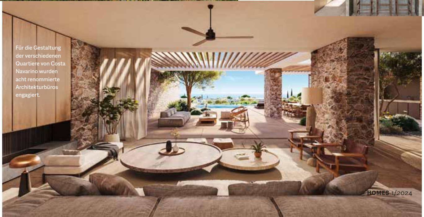
Für die Gestaltung der verschiedenen Quartiere von Costa Navarino wurden acht renommierte Architekturbüros engagiert.