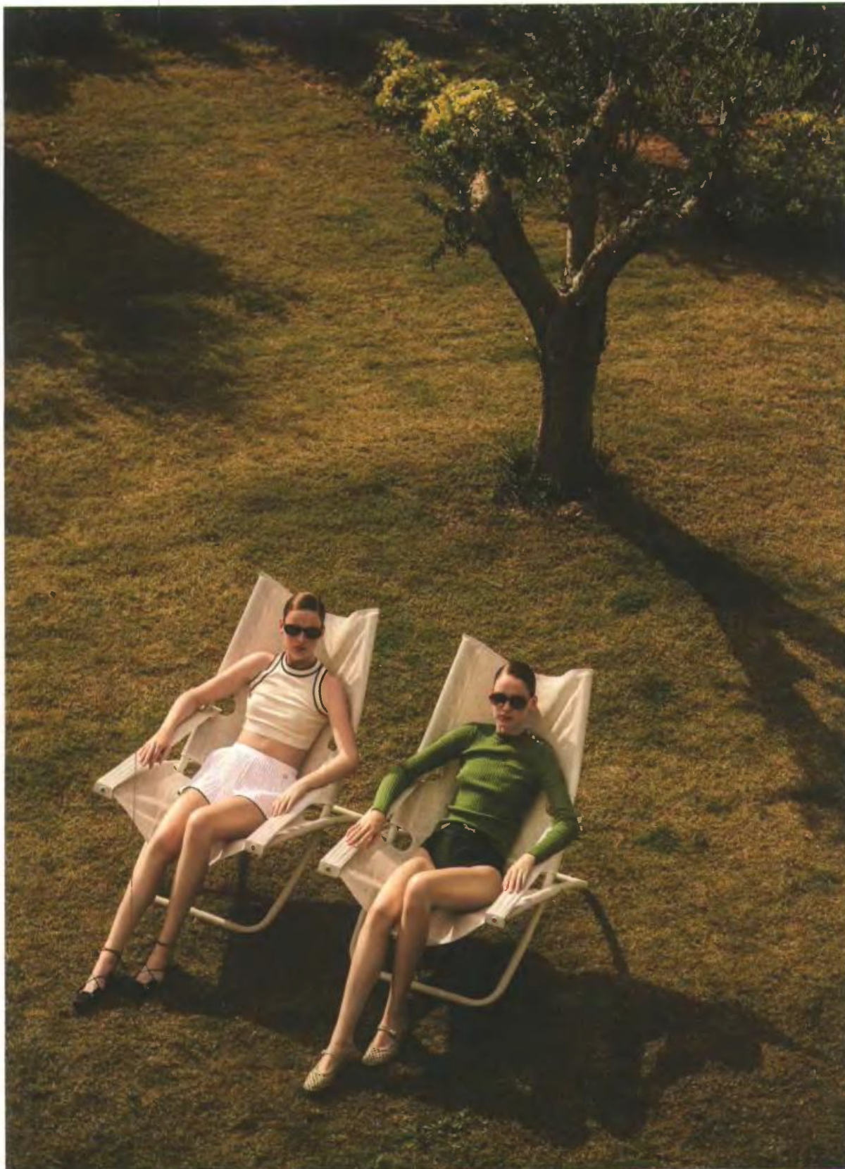
Βαμβακερή μπλούζα, MAX MARA BOUTIQUE. Πλισέ σορτς από βισκόζη JACQUEMUS, Attica. Γυαλιά ηλίου SAINT LAURENT, Delux Hellas. Σατέν μπαλαρίνες LE MONDE BERYL, Kalogirou. Πλεκτή βαμβακερή μπλούζα RABANNE, Ephy Monaco. Μπικίνι TORY BURCH, Attica. Γυαλιά ηλίου CHLOÉ, Delux Hellas. Δερμάτινες μπαλαρίνες LE MONDE BERYL, Kalogirou. Στην απέναντι σελίδα: Πλεκτή βαμβακερή μπλούζα και τούιντ σορτς MIU MIU, Luisa World. Πλεκτή βαμβακερή μπλούζα και σορτς AMI, Attica. Παπούτσια Jellies, ANCIENT GREEK SANDALS.